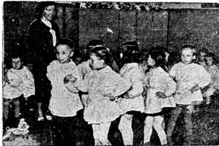
„Doi cite doi, jucînd și cîntînd, viața-i atât de frumoasă”.

Lunea aceasta a copiilor — căminul — are ceva fatnic și atât de gingaș încît pînă și pașii încerci să și ascunzi. Scăunele, măsuțe, dulapuri, totul pe potrivă copiilor, încărcate cu jucării de tot felul formează un decor ca de basm. Curățenia și liniștea ce domnesc și se par aproape nefirești într-un loc unde s-au adunat 40 de copii de