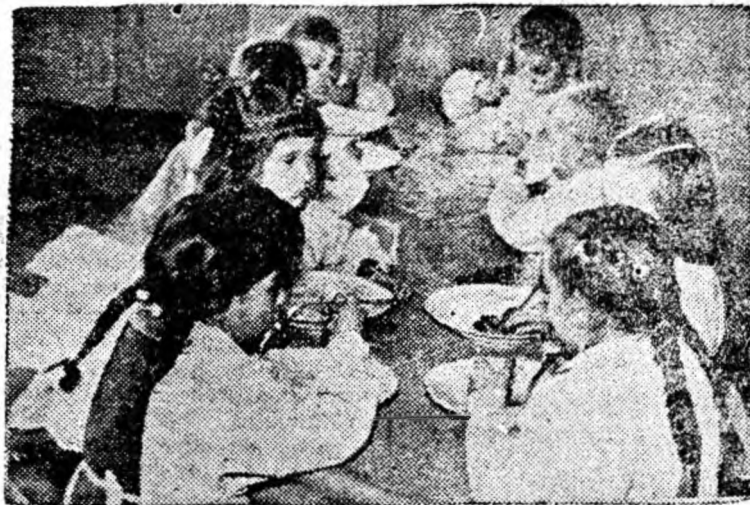
După „o muncă” de cîteva ore o masă gustoasă este bine venită pentru cei mici. Poftă bună!