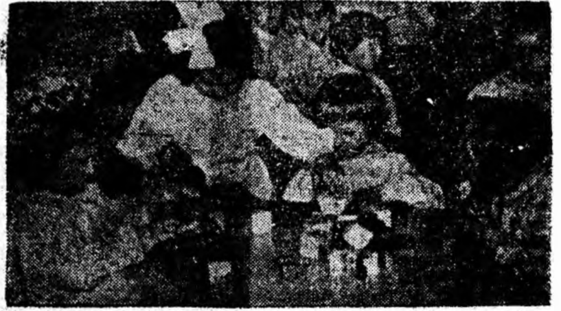
IN CLIȘEU: La căminul de zi al O.C.L. Industrial Petroșani peste 40 de copii fac primii pași „spre școală”.

Într-adevăr, primii pași spre școală îi face un copil în căminul de zi sau la grădinița de copii. Deși aici ei nu învață încă să scrie sau să citească, viața pe care o trăiesc în colectiv sub supraveghere atentă și permanentă a educatoarelor — cadre calificate în această muncă — îi pregătește pentru școala pe care o vor începe peste 2—3 ani. Jo-