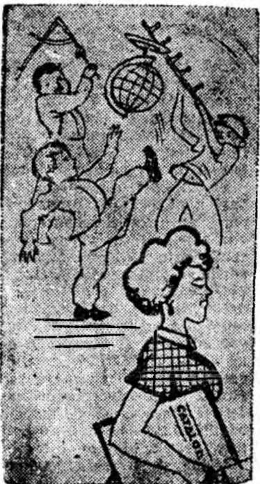
Prof. Plav: — Ce-mi pasă mie că le strică elevii, doar nu sînt ale mele...