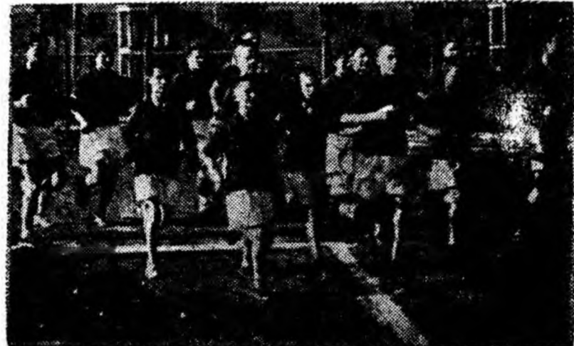
IN CLIȘEU: Start în proba de 1.000 m. rezervată juniorilor.

U.C.F.S. al raionului Petroșani trebuie să ia măsuri urgente, mergînd pînă la sancționarea unor asociații sportive care au manifestat o totală lipsă de preocupare în angrenarea tîne-