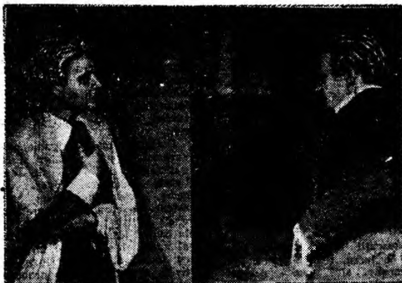
IN CLIȘEU: Un aspect din cadrul spectacolului cu piesa „Fiul rățacitor” de E. Ramnet, prezentat în Valea Jiului de Teatrul de stat din Petroșani, cu prilejul Săptămîinii teatrului și muzicii sovietice.

• Cehoslovacia ocupă în prezent locul trei în lume în domeniul extracției de cărbune pe cap de locuitor. Creșterea extracției de cărbune în Cehoslovacia în ultimii ani nu este egalată de nici o țară capitalistă. În următorii șase ani, adică pînă în anul 1965, extracția de cărbune brun va crește pînă la 77 milioane tone.