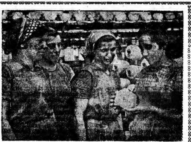
Cînd în secția de răsucit a Filaturii Lupeni s-a discutat problema îmbunătățirii calității țirilor răsucite s-a hotărît ca între muncitorii care lucrează la mașinile de răsucit și cele de la transportul bobinelor să se organizeze periodic mici consfățuiri. Iată-o pe tovarășa Marton Mag-

Hotărârile adoptate de conferință, criticile și propunerile făcute în cadrul ei constituie pentru comunistii de la mina Petrila un program concret de ridicare a muncii de partid la nivelul cerințelor.