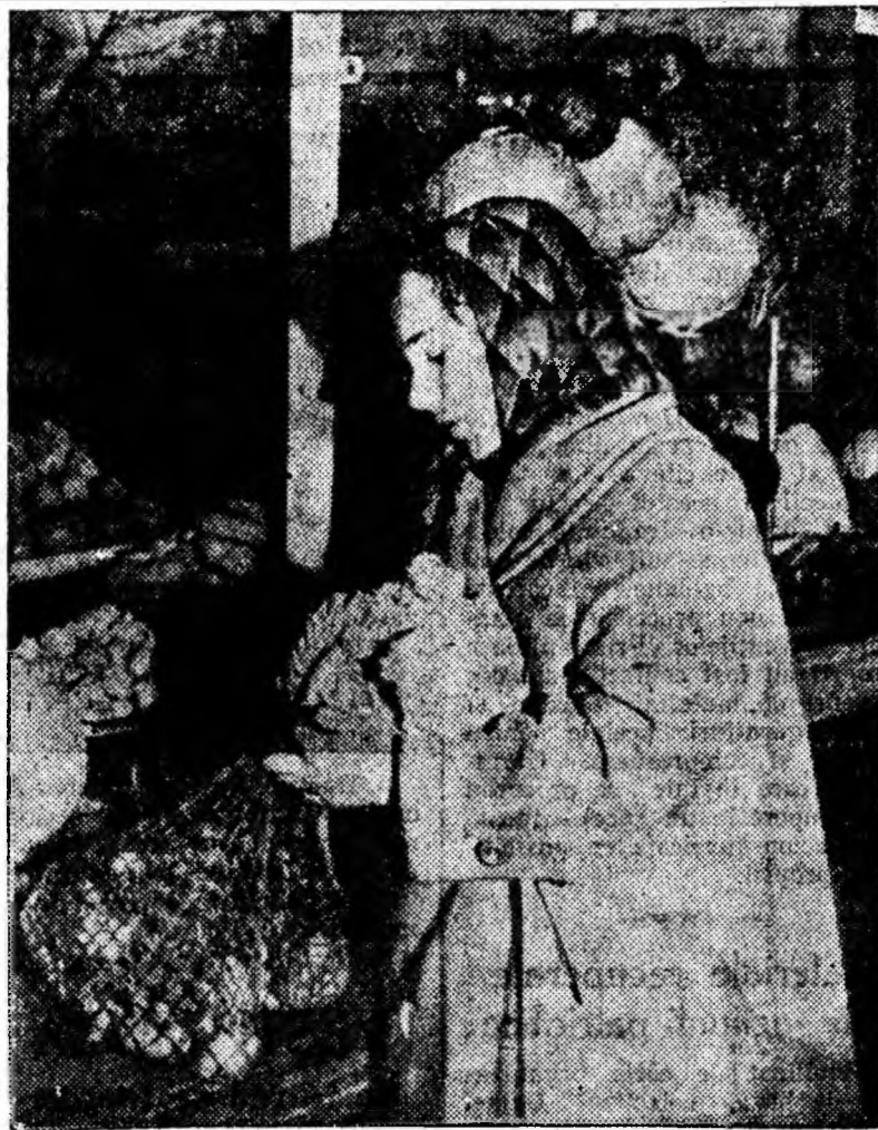
În capitala Uniunii Sovietice se consumă în fiecare zi atâtea fructe și zarzavaturi încât adunate la un loc ar forma adevărați munți. În medie pe zi se distribuie 2000 tone de cartofi, 2000 tone de varză, 200 tone morcovi, ceapă și altele. În fotografie o gospodină sovietică la magazinul de desfacere nr. 19 de pe strada Leningrad.

Pe linia ferată a regiunii Sverdlovsk a fost electrificat sectorul Sverdlovsk-Drujnino în lungime de 80 km. Pe linia ferată a regiunii Gorki a fost electrificat sectorul Vladimir-Petușki în lungime de 60 km.