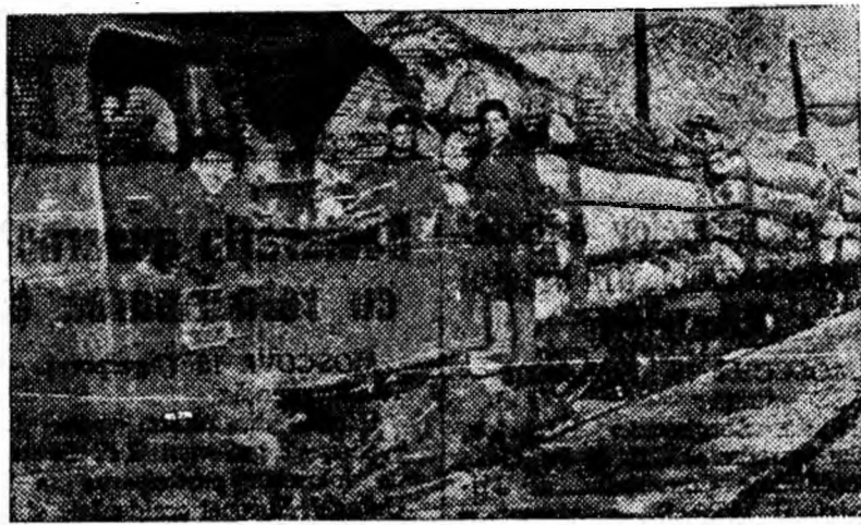
Se aduce de la pădure un nou transport de lemn de armare pentru mina Petrila

Abonamentele se primesc de către difuzorii din întreprinderi și instituții, de către factorii poștali și la oficiile P.T.T.R.