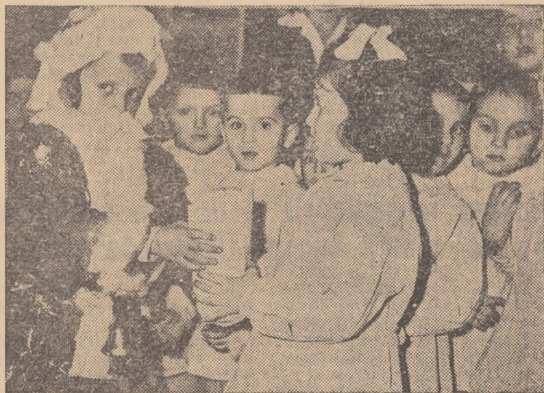
IN CLIȘEU: „Moș Gerilă” în „exercițiul funcțiunii”.

Cînd educatoarea căminului de copii O.C.L. Petroșani anunță sosirea oaspetelui așteptat, zumzețu ca de albine al vocilor celor prezenți încetă ca prin farmec, apoi trei vorbe se fugăriră prin încăperea largă, iscîndu-l din nou: