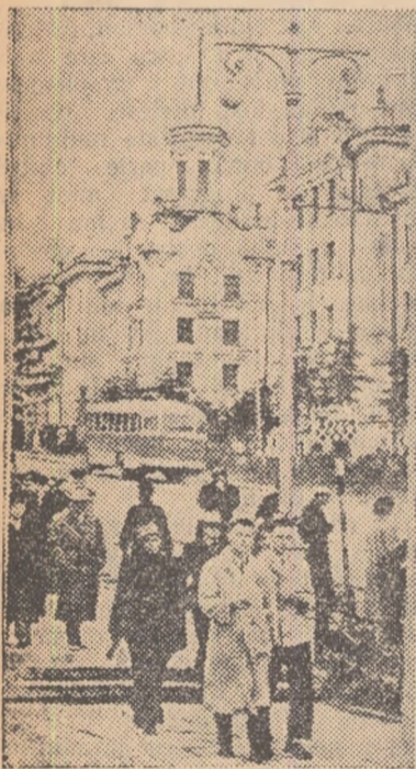
ÎN CLIȘEU: Vedere parțială a orașului Magadan centrul regiunii Kolima din Orientul Îndepărtat sovietic.

Conform hotărîrii Consiliului Mondial al Păcii, aniversarea a 50 de ani de la moartea lui Lev Tolstoi se va comemora în întreaga lume. În acest scop, în Uniunea Sovietică a fost creat un Comitet unional sub președinția eminentului scriitor sovietic Leonid Leonov. Editurile sovietice publică în tiraje mari operele lui Lev Tolstoi, monografiile consacrate vieții și activității marelui scriitor.