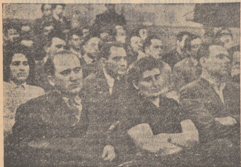
Aspect din sală. In medalion: acad. Gr. Moisil în timpul prelegerii

crescut și posturile de deservire a agregatelor și utilajelor miniere. Se pune deci tot mai hotărât problema trecerii la o fază superioară, faza de automatizare a proceselor de producție. Ca să se treacă la aplicarea automatizării sînt însă necesare cadre pregătite bine în această direcție. Luni după-amiază a avut loc în sala clubului A.S.I.T. din Petroșani ședința festivă de