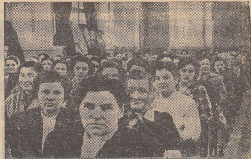
Duminică în sala A.S.I.T. din Petroșani s-au desfășurat lucrările Conferinței raionale a femeilor din Valea Jiului. Iată un aspect din sală din timpul desfășurării lucrărilor conferinței.

Au trecut aproape 40 de ani de cînd Altman a lucrat în cabinetul lui Lenin de la Kremlin, dar el vorbește încă și astăzi cu emoție despre acest episod din activitatea sa, amintindu-și mereu noi și noi amănunte. Artistul păstrează cu sfințenie o foaie de hîrtie cu un