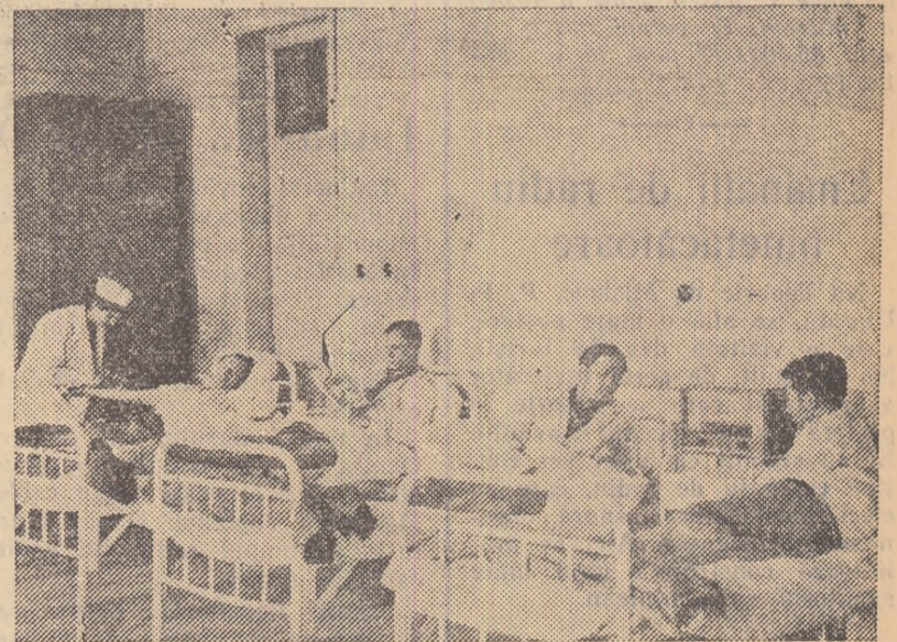
În Orașul nou-Uricani funcționează un staționar medical. Staționarul este înzestrat cu 25 paturi și personal medico-sanitar bine pregătit. ÎN CLIȘEU: Un aspect dintr-unul din saloanele staționarului

„Iskra” întemeiat și condus de el, ziar care a jucat un rol uriaș în crearea partidului bolșevic.