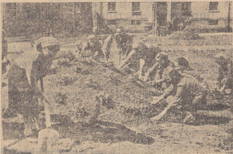
ÎN CLIȘEU: După ce un rond a fost săpat un grup de gospodine și copii au trecut la șădirea răsadurilor de flori.