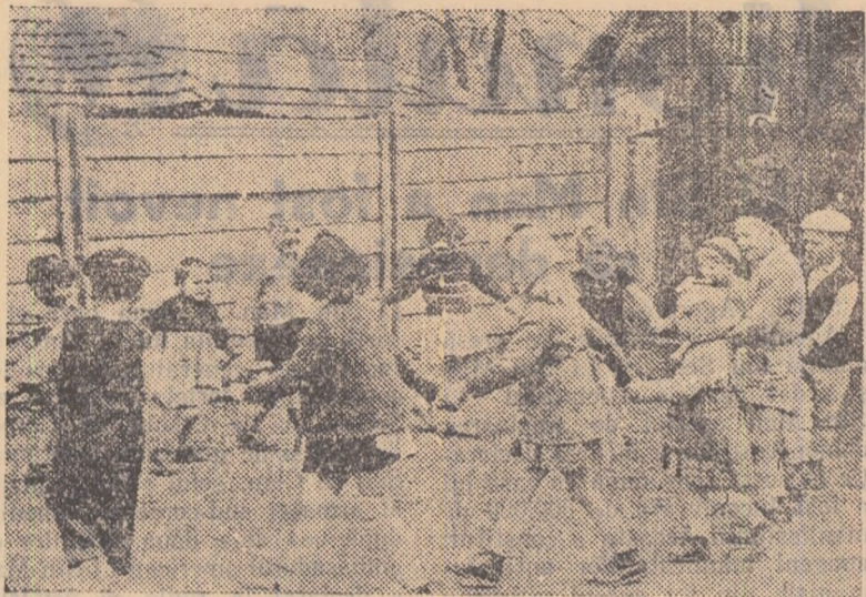
Acum câteva zile, când a trecut pe strada I. V. Stalin din Lonea fotoreporterul nostru a fost oprit din drum de un ris cristalin. În curtea grădiniței de copii a secției maghiare mai mulți copii sub supravegherea educatoarei desfășurau un joc în aer liber. Fericită copilărie... Obiectivul fotografic a surprins copiii în timpul jocului.