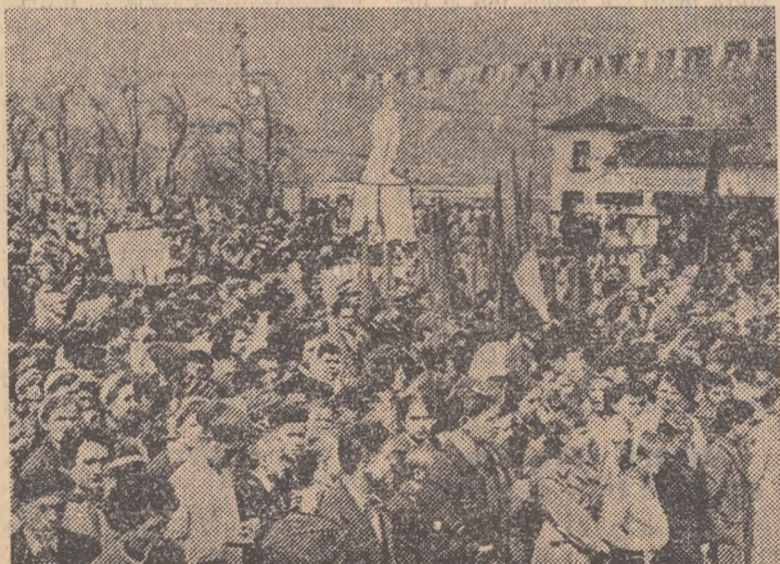
Aspect de la mitingul din Piața Victoriei (stînga). Momentul încheierii demonstrației din Petroșani. În fața tribunei, mii de oameni manifestindu-și bucuria prilejuită de sărbătorirea celui de-al 16-lea 1 Mai liber (dreapta).