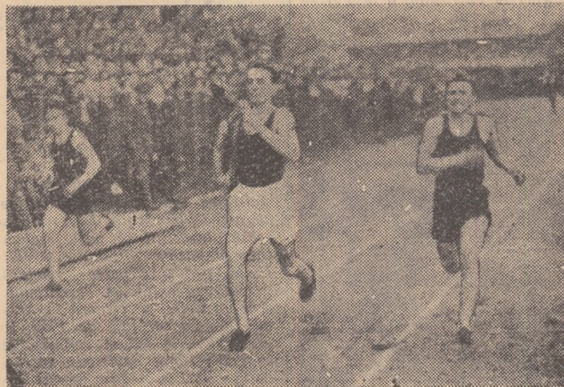
IN CLIȘEU: Primele concursuri ale tinerilor atleți din centrul de pregătire Lupeni.

Un centru de antrenament pentru copii și juniori