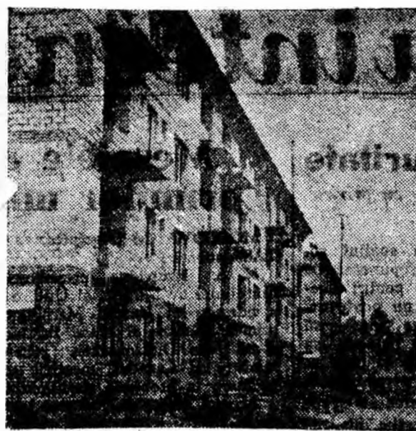
Aspect cotidian din Vulcan, Mica străduță a „Ghețarilor” îmbracă halna nouă a blocurilor moderne.