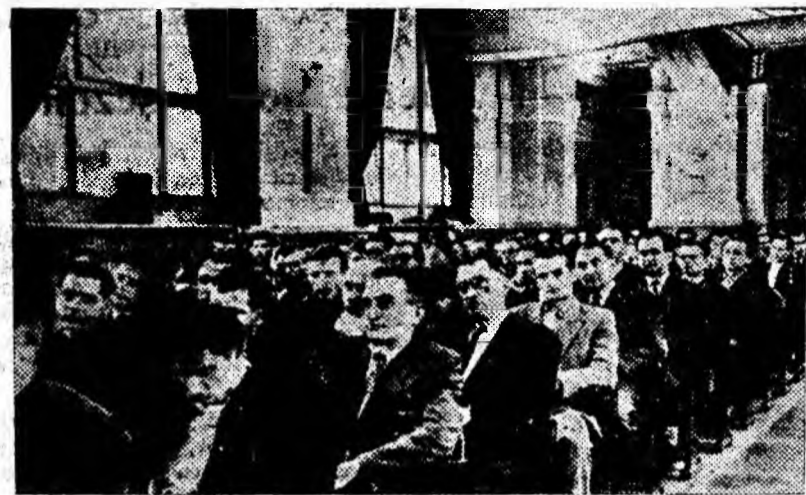
Aspect de la conferința.

Ceea ce a caracterizat lucrările Conferinței sindicatelor din ramura minieră și geologică a fost hotărârea fermă de a lupta pentru traducerea în viață a sarcinilor pe care cel de-al III-lea Congres al P.M.R. le pune în fața industriei extractive în cadrul planului de 6 ani, cu privire la sporirea producției de cărbune cocsificabil, de minereu de fier și de minereuri complexe, îmbunătățirea calității