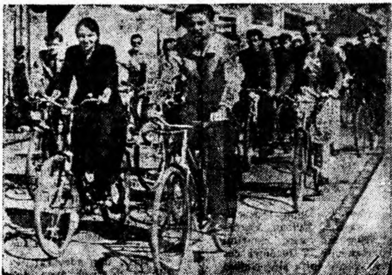
IN CLIȘEU: Grupul celor 25 de tineri din Lonea trecînd prin Petroșani spre Vulcan unde avea loc întîlnirea triunghiulară de ciclo-turism