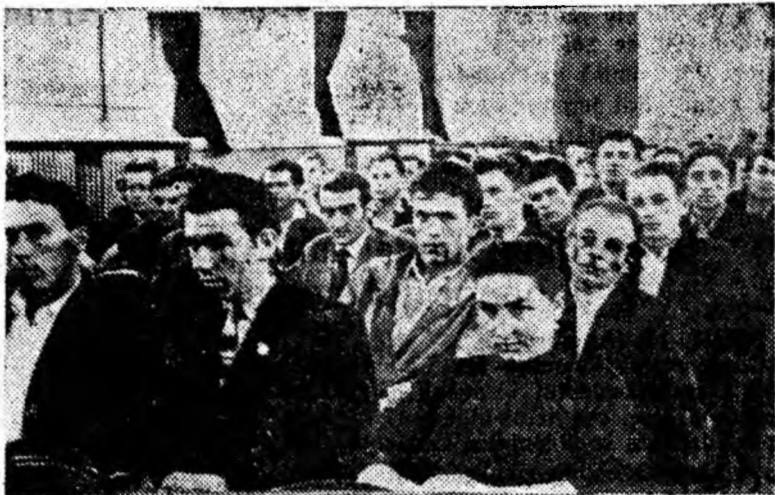
IN CLIȘEU: Aspect de la consfătuire.

dor despre contribuția brigăzilor de tineret din sectorul IV al minei Petrila la realizarea sarcinilor de plan, cit și discuțiile pur-