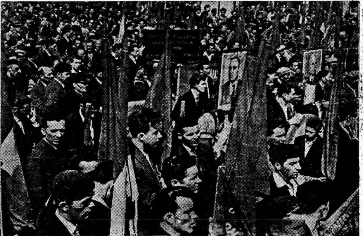
Aspect de la mitingul oamenilor muncii din Petroșani.

Președintele Prezidiului Sovietului Suprem al U.R.S.S.