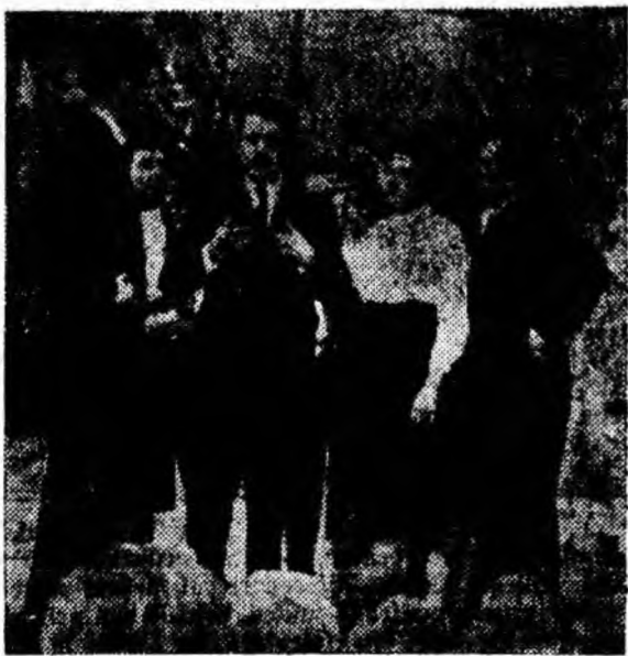
IN CLIȘEU: Brigada artistică de agitație de la Aninoasa.

loacele artei teatrale brigăzile artistice de agitație din Aninoasa (scena în care se critica faptul că în clubul din Aninoasa a pătruns ploaia prin acoperiș, ca și cea cu cifrele de care am mai amintit), din Petroșani (de pildă cea a cooperativei meșteșugărești „Jiul” cînd aduce în scenă un moment evocator din lupta pentru eliberare