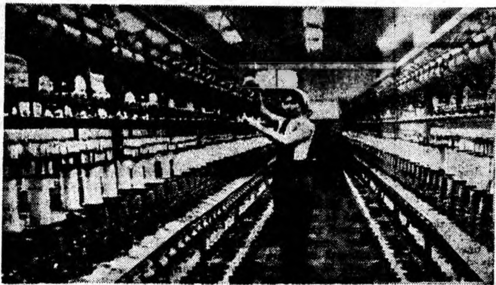
Laptele a intrat în secția de prelucrare. Manipulantului nu-i rămâne decât să urmărească desfășurarea procesului de producție. IN CLISEU: Aspect de la colhozul „Stalin” din Kuban unde procesul de prelucrare a laptelui este complet automatizat.