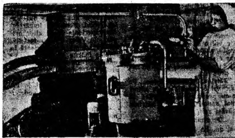
O nouă secție a fabricii de ciorapi „Aurora” din Riga.

Prima instalație industrială realizată de Makinski funcționează deja de opt luni la o mare termocentrală de pe peninsula Apseron. Cu ajutorul ei, câteva cazane cu abur ale centralei au fost trecute la funcționarea pe bază de apă de mare.