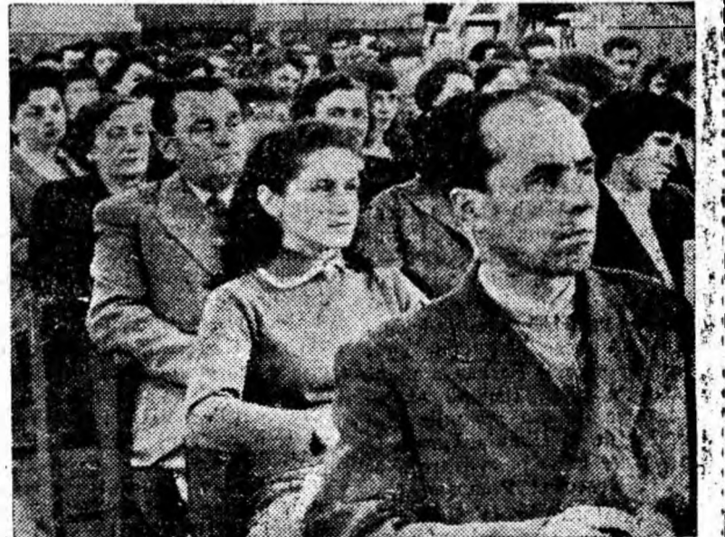
IN CLIȘEU: Un aspect din timpul consfătuirii raionale a cadrelor didactice din Valea Jiului.