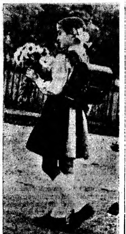
— Drum bun!