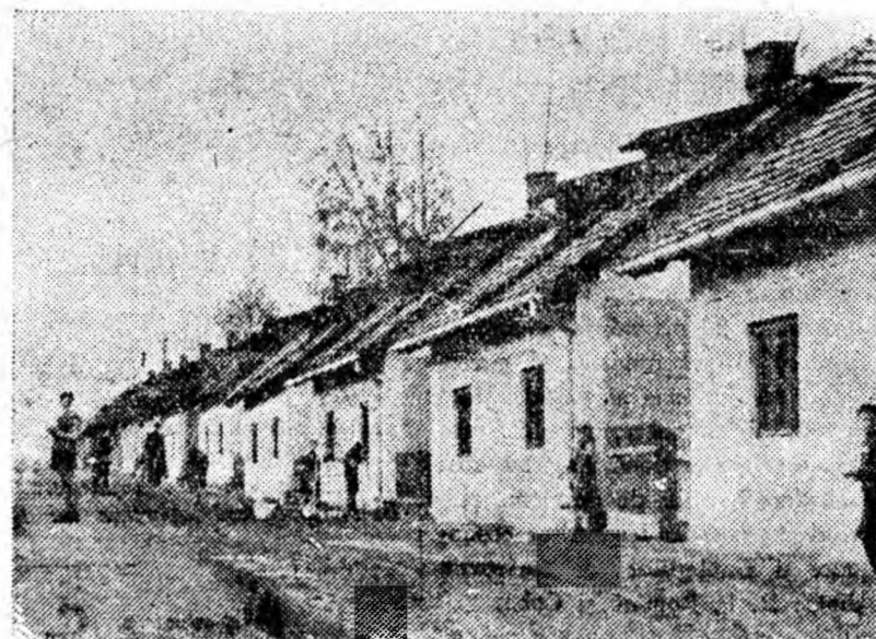
Echipele de întreținere a fondului de locuințe din Lupeni în ultimul timp au efectuat numeroase reparații curente la casele din cartierul Ștefan și din cartierul Braia.

O altă sarcină deosebit de importantă pusă de adunarea pentru darea de seamă și alegeri în fața comunistilor sectorului, este desfășurarea unei largi munci politice și organizatorice pentru îmbunătățirea calității cărbunelui extras. S-a arătat că de la începutul anului și pînă în prezent, cu excepția unei singure luni, procentul de cenușă în cărbune a fost mai