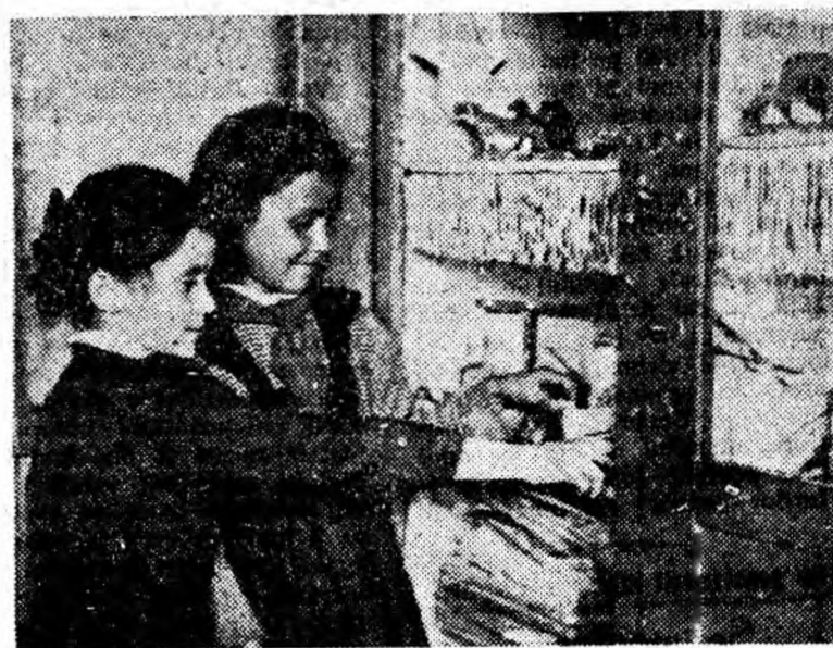
La Școala de 7 ani nr. 1 Lupeni a fost amenajat de curînd un nou colț al camerei muzeu. Într-un dulap special, au fost aranjate în ordine multiple eșantioane de diferite minereuri, folosite ca material didactic. Zilnic, în fața acestui dulap se opresc mulți elevi care privesc eșantioanele de minereuri.