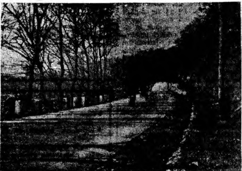
Toamna a poposit din nou și pe meleagurile Uricaniului. Obiectivul fotografic a surprins un peisaj de toamnă pe șoseaua Uricaniului

Proiectul acestui agregat „care gîndește” și datorită căruia se realizează anual pînă la 4 milioane ruble economii, a fost elaborat de Institutul „Stalproekt” în colaborare cu unul din institutele de cercetări științifice.