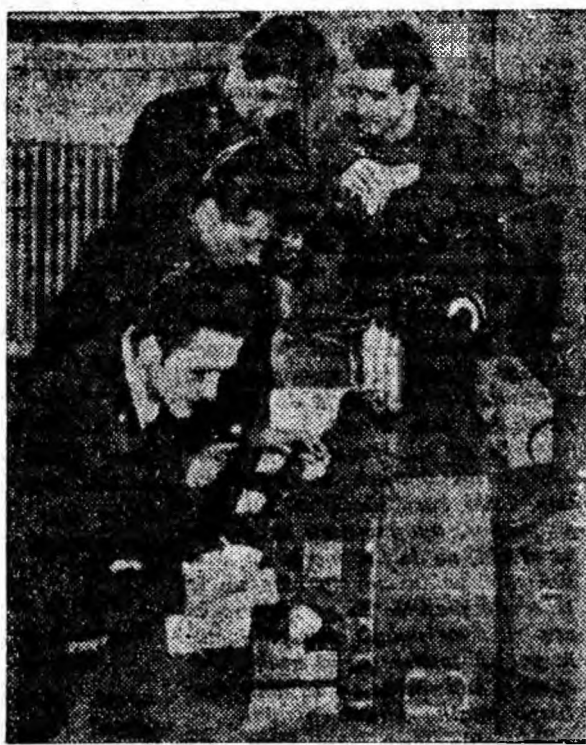
IN CLIȘEU: În laboratorul de electrotehnică

Aceasta nu este însă totul. Tovarășii de aici proiectează introducerea de noi lucrări astfel ca în scurt timp cele două săli să devină cele mai dotate laboratoare.