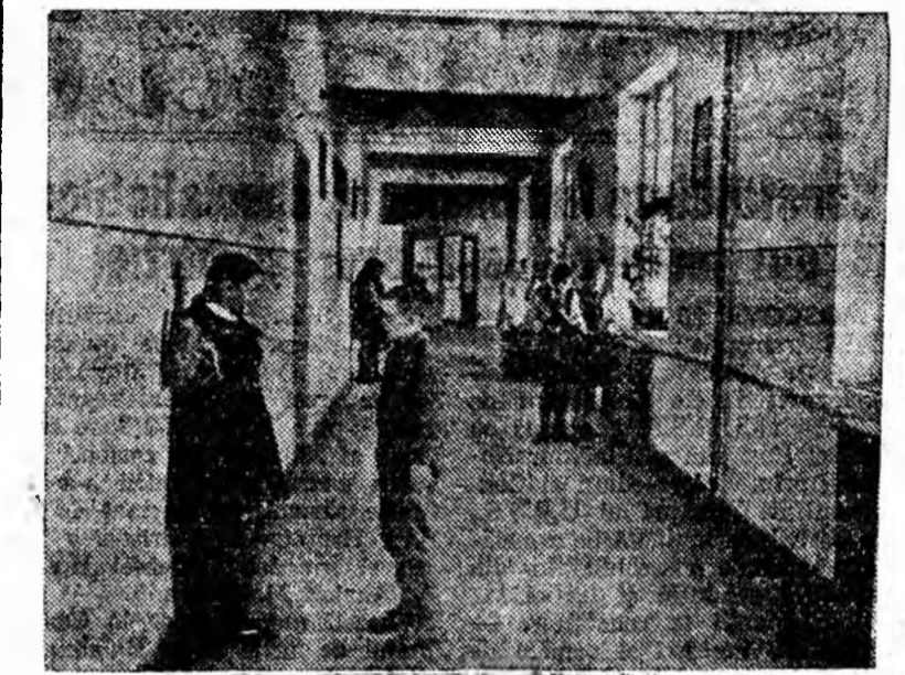
În locul vechii școli elementare, neîncăpătoare pentru numărul mereu crescînd al școlărilor din Paroșeni în centrul cartierului din Șohodol-Paroșeni s-a construit o școală nouă, cu 16 săli de clasă, cu laboratoare și încălzire centrală.

Experiența a dovedit că succesul luptei pentru calitatea cărbunelui se hotărăște în abataje. În acest scop, birourile organizațiilor de bază și-au îndreptat aten-