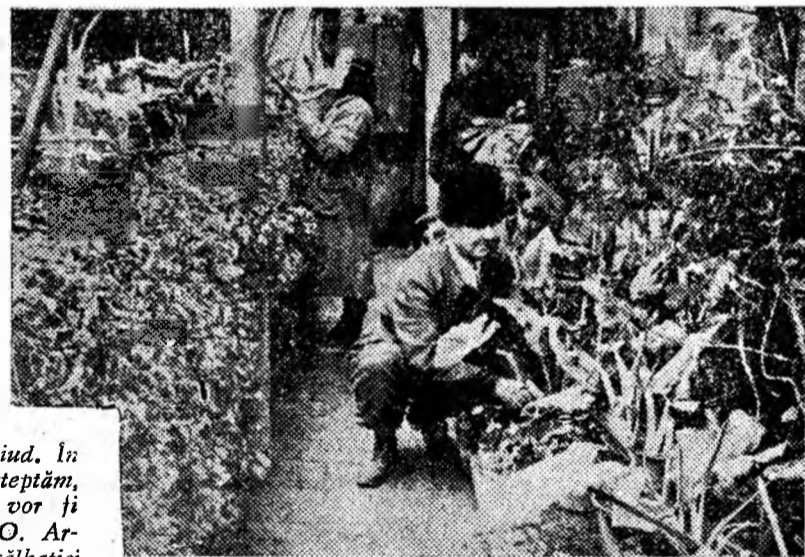
În seră, îngrijind florile

În afară de aceasta, pe loturile din jurul serelor, care anul trecut au fost mult mărite, au fost însămînțate din toamnă peste 24.000 pansele, zeci de mii de petunii, garoafe și multe alte specii de flori, care vor fi răsădite pe rondurile din oraș. Locul lor va fi luat apoi de alte flori, și astfel micul colectiv de aici va contribui, prin munca lui, la înfrumusețarea vieții locuitorilor Văii Jiului.