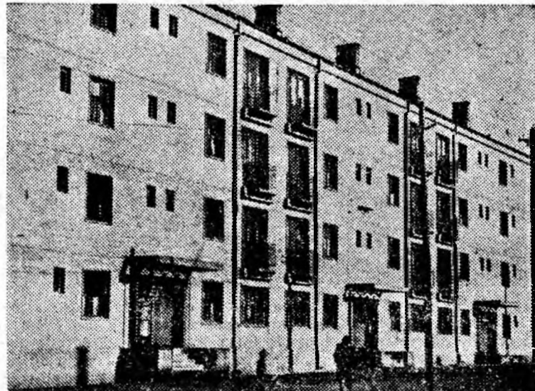
Unul din blocurile de pe lunca Livezeni.

Comitetul Central al Partidului Muncitoresc Român Consiliul de Miniștri al Republicii Populare Romine