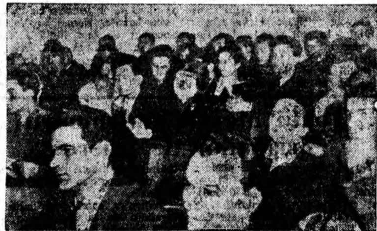
Lucrările sesiunii științifice au fost urmărite cu viu interes de un numeros public format din ingineri, specialiști, studenți. ÎN CLIȘEU: Aspect din timpul lucrărilor sesiunii.