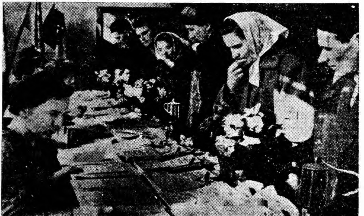
Niciodată Școala de 7 ani nr. 1 din Petrila nu a cunoscut o animație atît de mare ca ieri. Încă din primele ore ale dimineții un mare număr de oameni ai muncii din Petrila au venit să-și dea votul lor candidaților F.D.P., după cum se vede și în clișeu de față.

Noi, slujitorii artei am venit sărbătorește la vot, ne-am dat cu încredere votul nostru candidaților vîdeții noi, în numele înfloririi minunatei arte a societății noastre.