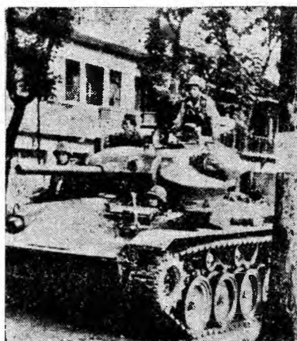
ÎN CLIȘEU: Mercenari puși în slujba grupului reacționar condus de Oum-Nosavan, pe tancuri puse la dispoziția lor de imperialiștii americani.

Căpitanul Kong Le președintele Comitetului militar național al Laosului a declarat că trupele guvernamentale și poporul Laosului vor nimici bandele ciankaiștilor și le vor alunga de pe pămîntul Laosului.