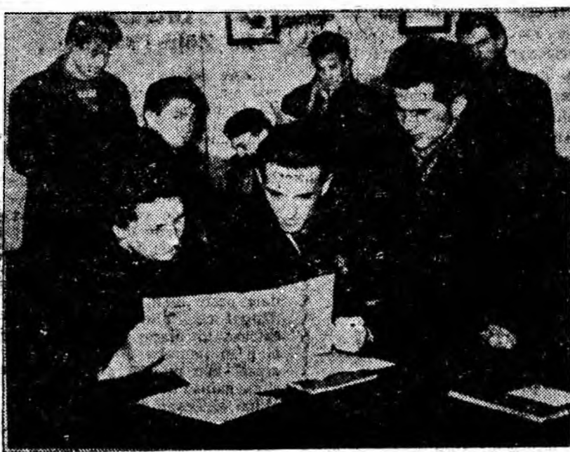
Cit de interesante pot fi după-amiezele la club. Să joci șah, să urmărești repetițiile dansatorilor sau să citești o carte sînt mijloace prin care te poți odihni și în același timp și căpăta cunoștințe noi.

Astăzi, întreaga lume cinstește memoria marelui poet ucrainean, Taras Șevchenko, prin comemorarea centenarului morții sale alături de cei mai iluștri oameni de știință, artă și literatură din lumea întreagă.