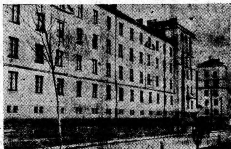
Blocuri din noul cartier 7 Noiembrie din Petritia