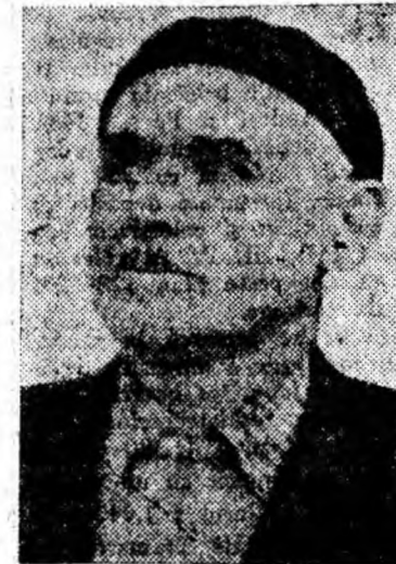
SZKOUPI VINCENȚIU scara 1, bloc 23