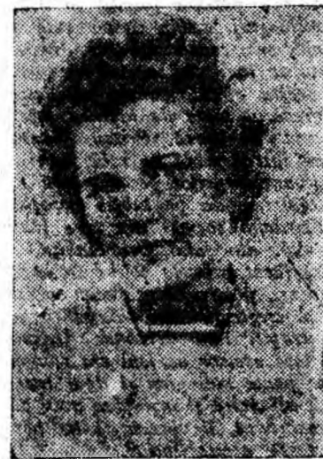
KISS STANCUȚA scara 1, bloc 17