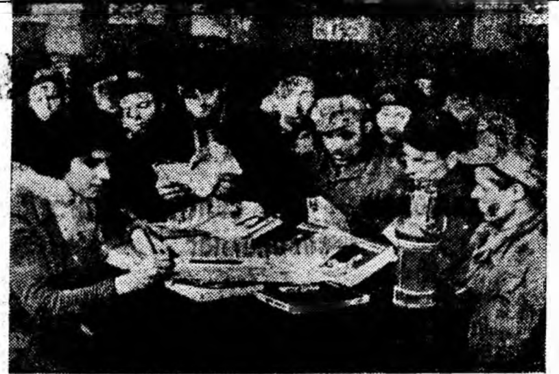
Pentru minierii din Petrița a devenit un obicei ca la fiecare salariu să treacă pe la standul de cărți din sala de apel a minei. Aici, prin grija „Librăriei noastre” este amenajat în permanență un stand de cărți cu ultimele lucrări din literatura politică, tehnică și beletristică. ÎN CLIȘEU: Minieri, în fața standului de cărți în sala de apel a minei Petrița.