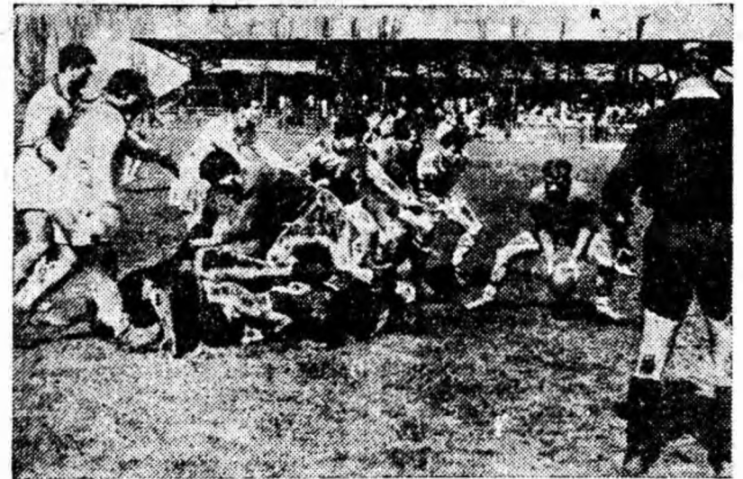
IN CLIȘEU: O fază din joc în care Mateescu încearcă o deschidere pe trei sferturi.