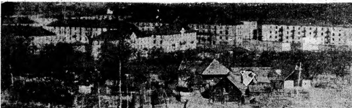
Uricani — Orașul nou al Văii Jiului. Cite nu s-au scris pînă acum despre blocurile lui, despre viața tot mai frumoasă pe care o duc minerii care locuiesc în apartamentele din blocurile acestui oraș!

Dar aici, a fost și un Uricani vechi — sîtuc cu case mici de lemn, ale păstorilor din bătrîni. Unele din aceste căsuțe, situate pe platoul de pe malul drept al Jiului, au rămas și acum.