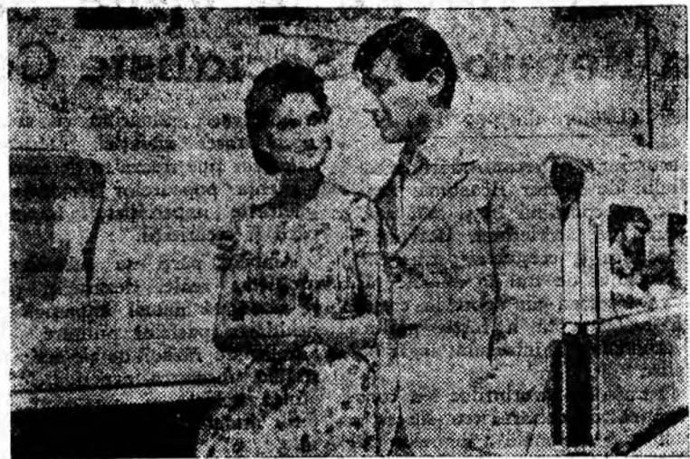
ÎN CLIȘEU: O scenă din film.

Noul film romînesc „Mindrie” realizat de regizorul Marius Teodorescu, se inspiră din problematica vieții noastre, avînd o temă de strictă actualitate.