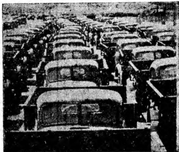
Automobilele produse de uzina din Kutais pot fi întâlnite pe toate șoselele țării.

Gigantul textil va ocupa o suprafață de aproape 4 ha. Vor fi instalate peste 115.000 fusuri de răsucit și filat, aproximativ 800 de războaie de țesut și alte agregate. Dirijarea producției se va face de la un punct central de dispecer, înzestrat cu o aparatură specială.