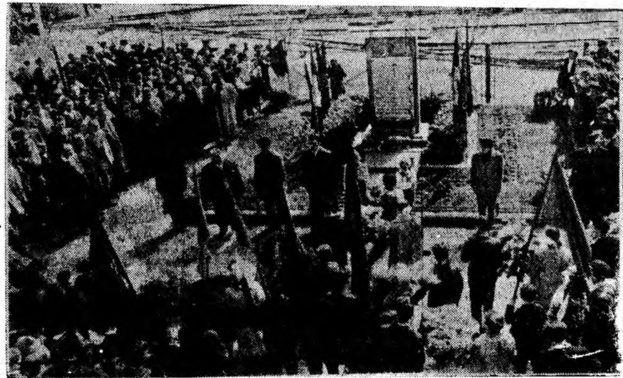
La placa comemorativă din incinta minei

spre uzina electrică unde o altă placă comemorativă amintește de cei ce s-au jertfit. Și aici s-au depus coroane și flori. În apropiere de uzină se află un canal prin care apa se scurge lin, fără nimic deosebit. Dar și el are o semnificație. Prin acest canal s-au