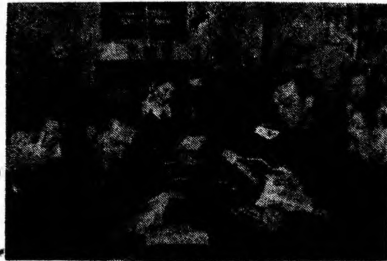
IN CLIȘEU: În sala de lectură a clubului din Lonea

cîteva din sălile cluburilor pentru a vedea ce fac artiștii amatori.