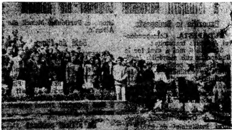
La placa comemorativă de la cimitir

trează un moment de reculegere după care coloana se îndreaptă spre Palatul cultural din Lupeni unde avea loc întîlnirea tinerilor din Lupeni cu activiști de partid, ai organizațiilor de masă și de stat, din regiune și Valea Jiur-