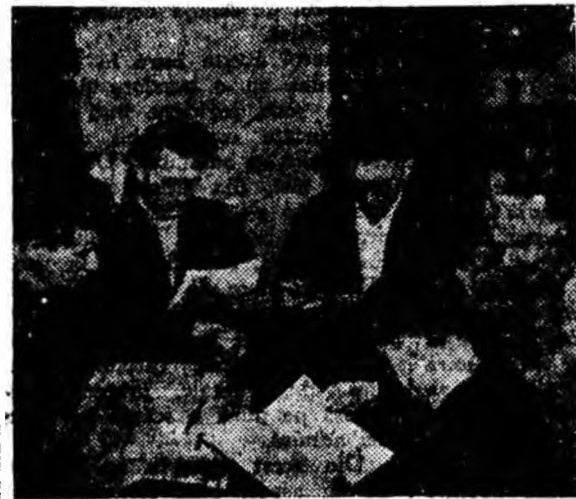
În sala de lectură a clubului.