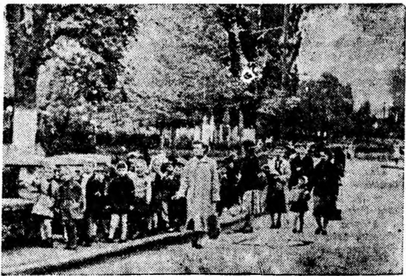
După zilele ploioase, soarele și-a arătat din nou fața-i zimbătoare, imblîndu-te din nou la plimbări. Iată-i pe copiii de la grădinița din cartierul Ștefan Lupeni. Ei au pornit spre club unde repetă la un program destinat sărbătorii de încheiere a anului școlar. Clubul e doar cel mai bun loc pentru pregătiri.

IN CLIȘEU: Copiii de la grădinița din cartierul Ștefan Lupeni în drum spre club.