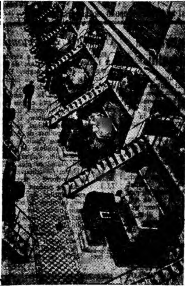
Un sector al unei secții noi de la fabrica de fibre sintetice din Riazan.

Înfăptuirea planurilor de irigație prevăzute va permite dezvoltarea continuă a culturii bumbacului în Turkmenia. Recolta anuală de bumbac va ajunge în republică, în următorii zece ani la două milioane tone, adică va crește cu mult față de nivelul actual. Turkmenia se va situa pe unul din primele locuri din U.R.S.S. în ceea ce privește producția de bumbac.