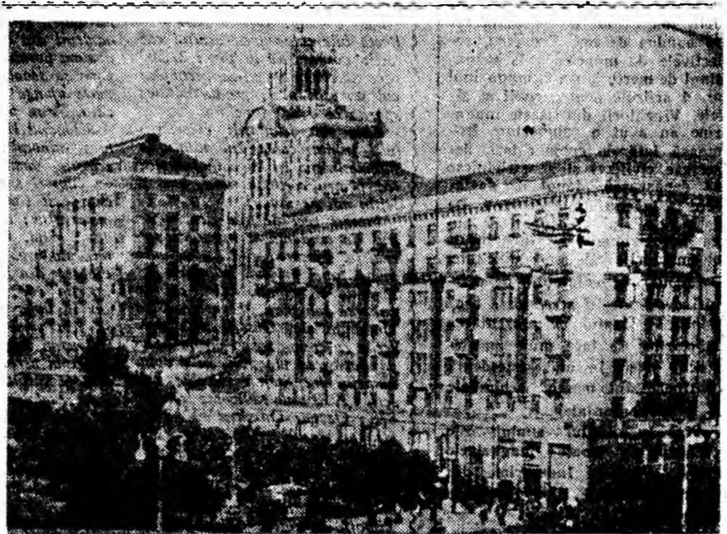
VEDERE DIN ORAȘUL KIEV

„Noile fabrici-giganți vor fi date în exploatare în cursul acestui an.”