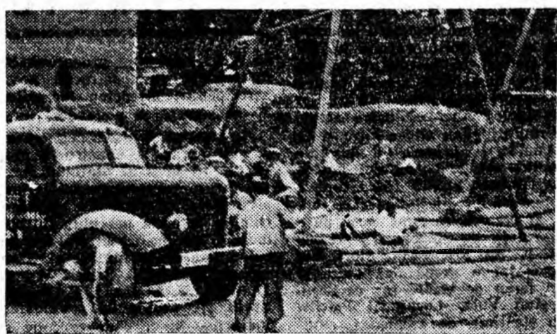
La Institutul de mine din Petroșani a început deja să se ridice zidul la viitorul cămin, iar pentru noul amfiteatru se sapă fundația.