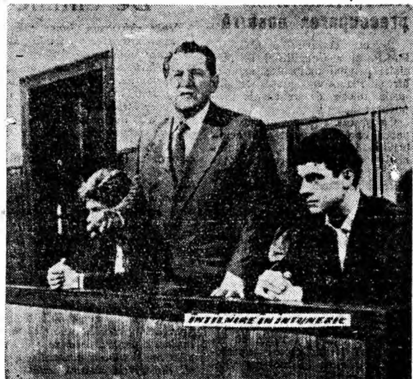
IN CLIȘEU: O scenă din film.

Filmul tratează o problemă actuală, militînd pentru pace, pentru întărirea violenței po-