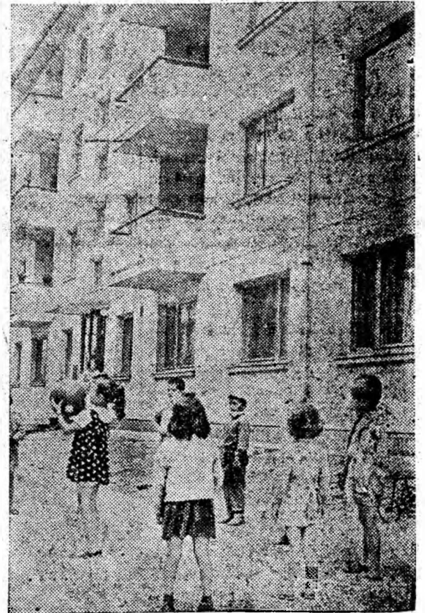
Nu e mult de cînd aceste minunate blocuri, din cartierul Livezeni Petroșani, și-au primit locatarii și copiii s-au și împrietenit, jucîndu-se cu voie bună în fața noilor lor locuințe.

De cîteva zile, aici, alături de graficele și lozincile existente s-au mai montat 12 panouri noi, frumos lucrate. Ele reprezintă chipurile celor mai