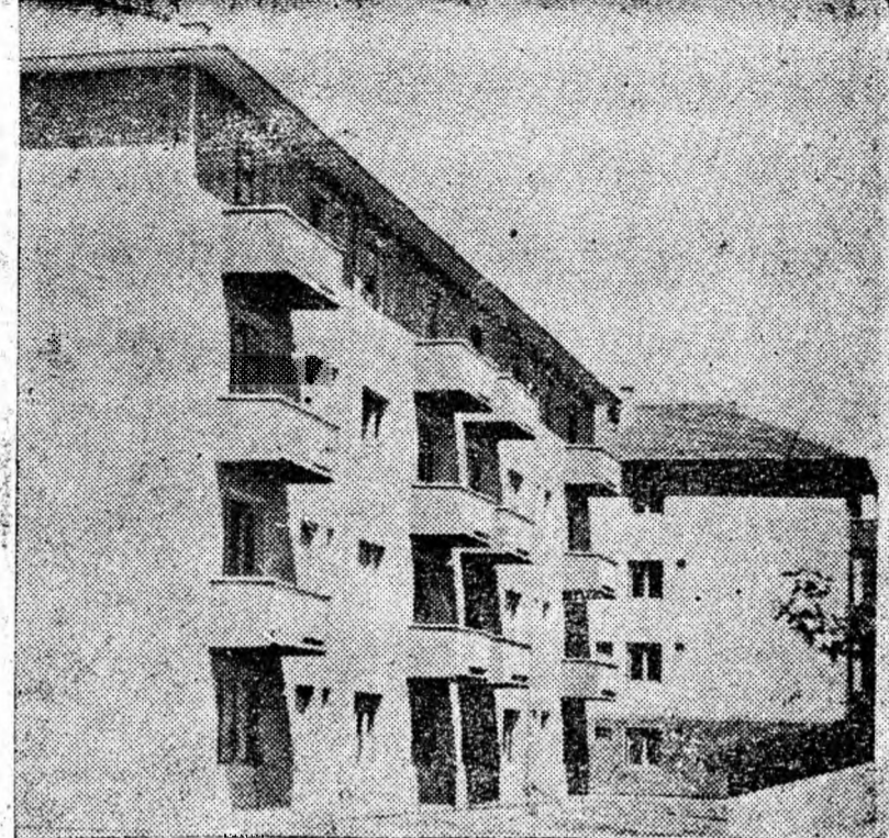
Blocul D cu 24 apartamente moderne, prevăzute cu încălzire centrală, este al patrulea bloc terminat în acest an de constructorii pentru minerii din Vulcan. Cu acestea numărul apartamentelor clădite la Vulcan în acest an, se ridică la 120. IN CLIȘEU: Vedere a noului bloc D din Vulcan.