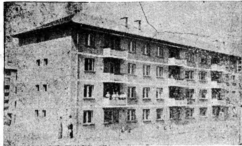
IN CLIȘEU: Blocul nr. 23 din cartierul Viscoza Lupeni, așteptîndu-și locatarii.

este departe de a reda frumusețea acestor blocuri. Linia elegantă, modernă, ferestrele mari, balcoanele cochete la care se adaugă și culoarea de un verde închis executată dintr-o vopsea cu soluție din material plastic — vinacet — îți lasă impresia unor blocuri din centrul frumoa-